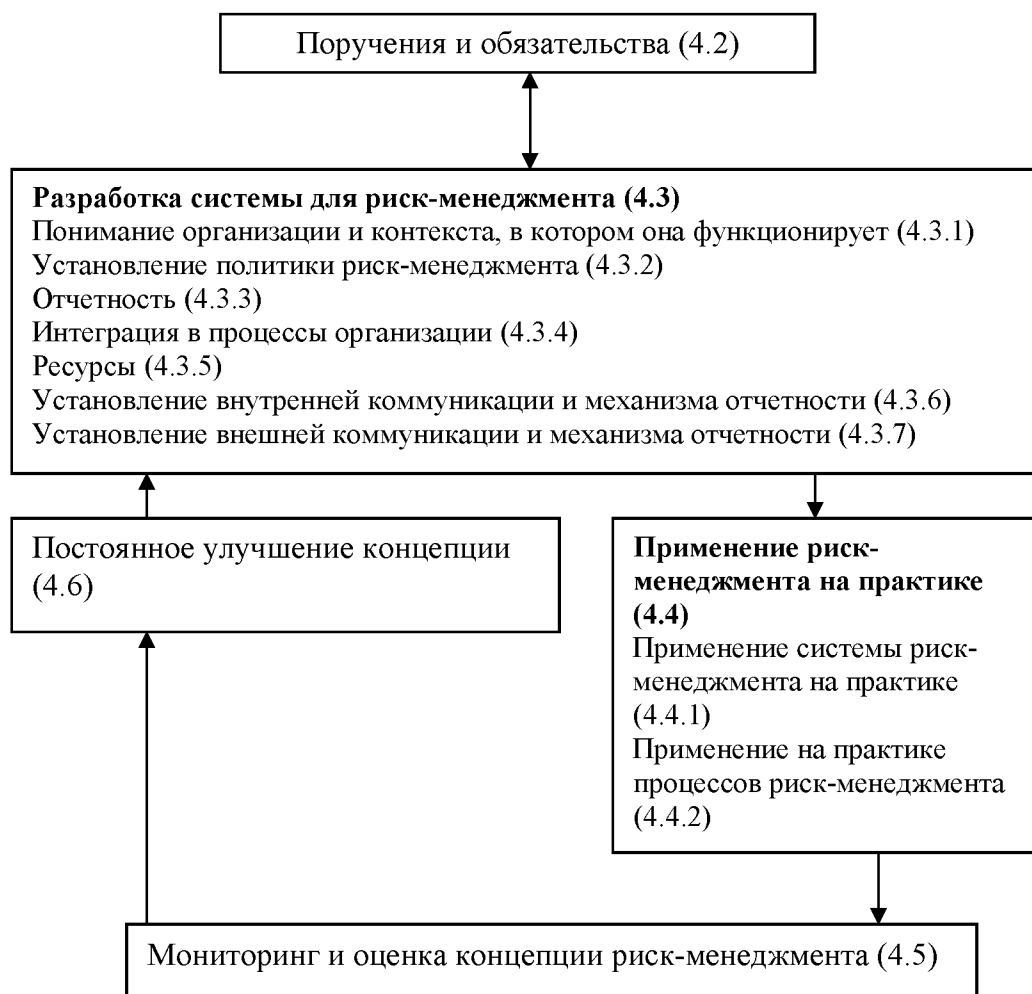
Схема 2 – Взаимосвязи между компонентами концепции риск-менеджмента

компоненты риск-менеджмента, и то, как они взаимодействуют в повторяющейся среде, как это показано в Схеме 2.